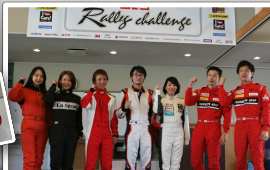
初参加のみなさん