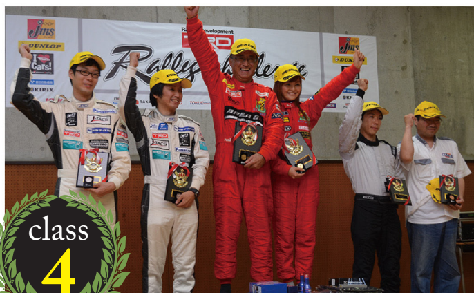
トヨタ車 (1500cc 以上) クラス