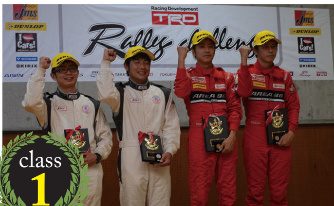
1500cc (NCP131) クラス