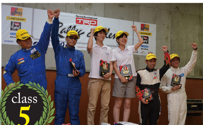
トヨタ車 (1500cc 未満) クラス