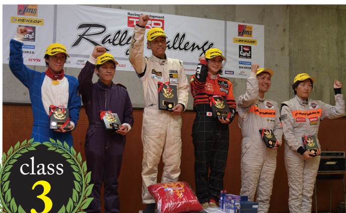
1000cc (SCP10) クラス