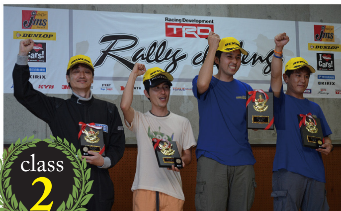
1500cc (NCP91) クラス