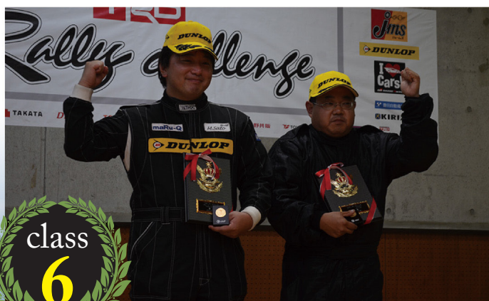
VitzRS TRD Racing (NCP91) 限定クラス