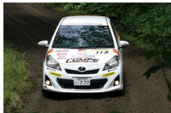
一台ずつの参加となったE-3クラスとC-2クラス。無理をしない堅実な走りだが、E-2クラスの86勢に次ぐ好タイムを刻みつけた。